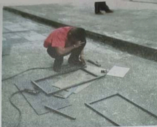
7.2 เชื่อมประกอบชิ้นงานให้สมบูรณ์