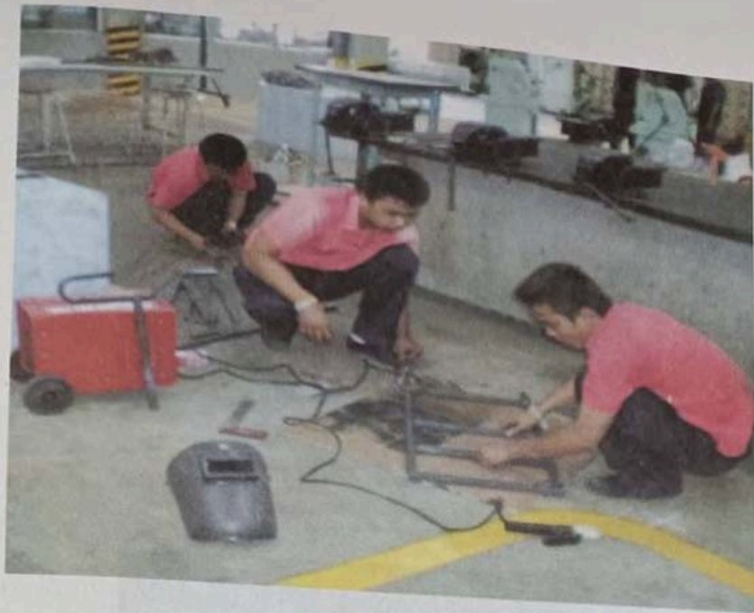
7. เคาะสแลก ตรวจสอบแนวเชื่อม